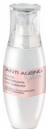
Latte Detergente con Ceramidi "DOUBLE VALUE EMULSION"