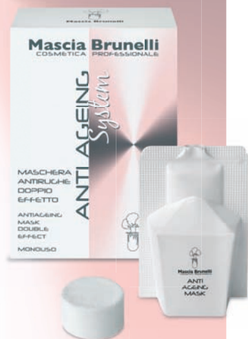
Maschera Antirughe "ANTI AGEING MASK"

Dati rilevati su un campione di persone con età 45/50 anni. Certificazione ricerca Università di Pavia.