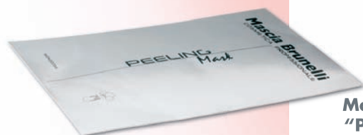
Maschera Peeling "PEELING MASK"

La pelle ha ancora il profumo della salsedine. Ora aiuta il tuo viso a ritrovare l'idratazione e la luminosità, con l'innovativo trattamento ANTI AGEING System . Una seduta davvero rigenerante, ma così delicata e naturale che può essere raccomandata anche sulla pelle abbronzata.